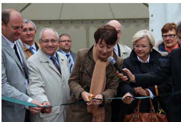
Inauguration le 26 septembre 2012